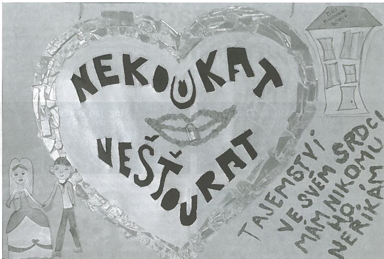
Helena Stamenkovičová, 16 let, ZŠ Jeseniova, Praha

údajů. Právě v tento den v roce 1981 bylo umožněno jednotlivým státům přistoupit k Úmluvě o ochraně osob se zřetelem na automatizované zpracování osobních dat , prvnímu ucelenému evropskému dokumentu na toto téma, který je pro přistoupivší státy závazný. Česká republika ji ratifikovala v roce 2001. Smyslem 28. ledna je upozornit každého na hrozby, které s podceňováním ochrany soukromí a osobních údajů souvisejí, a jejich důsledky, ať už jde o finanční ztráty, psychické újmy, ale bohužel – což je o to závažnější právě u dětí a mládeže, navíc pokud nejsou s těmito nástrahami ať už jakýmkoli způsobem obeznámeny –, i újmy nejvyšší.