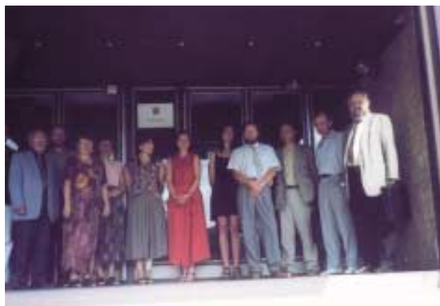
Takoví jsme byli v roce 2000...