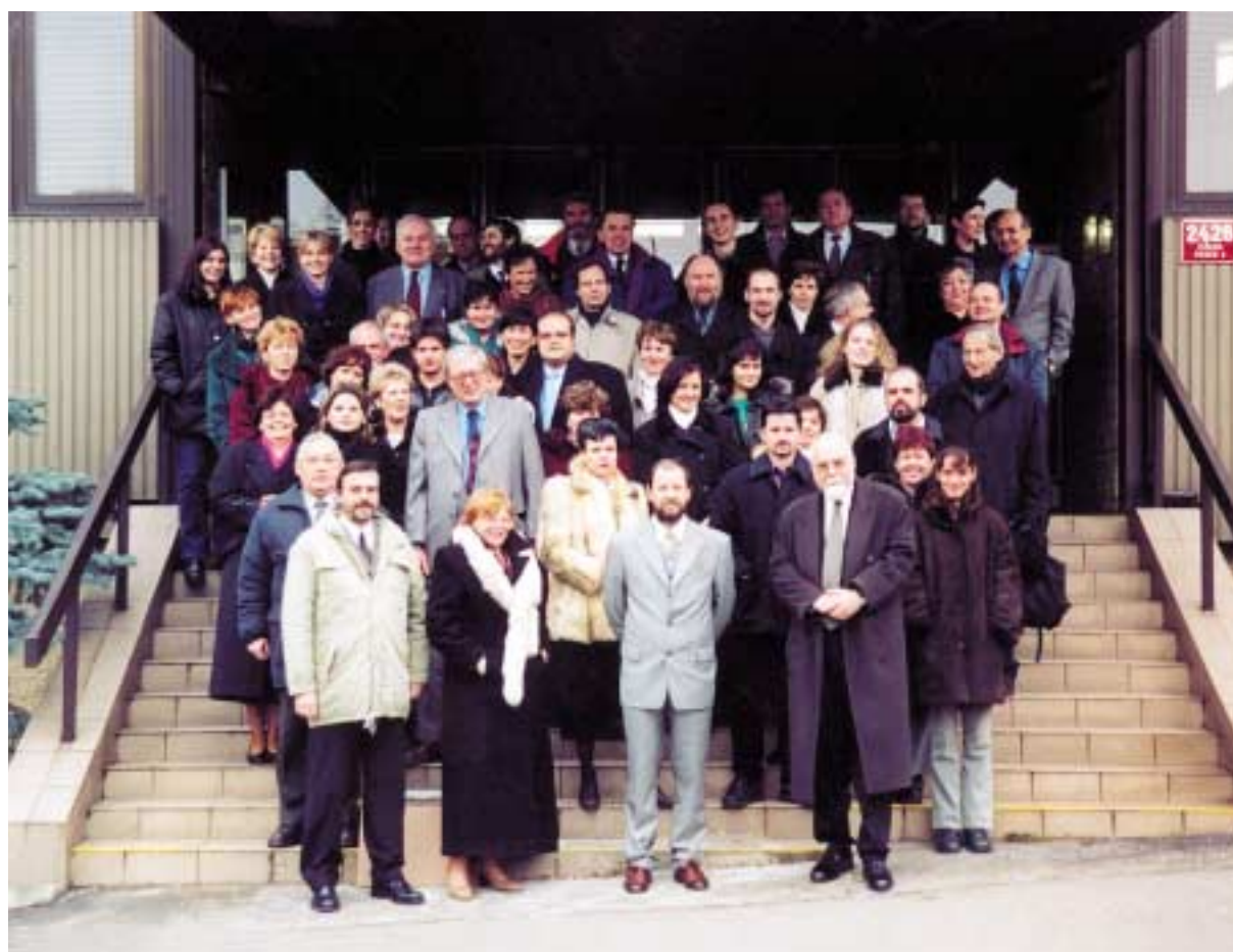
Úřad pro ochranu osobních údajů – 19. 12. 2001